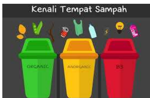
Gambar 2. 3 Jenis Sampah

Limbah B3 mengandung zat berbahaya yang dapat berdampak negatif bagi manusia dan lingkungan. Beberapa contoh limbah B3 adalah produk yang mengandung merkuri, seperti penyemprot cat, pewangi, pembersih lantai, semir kayu, dan perekat.