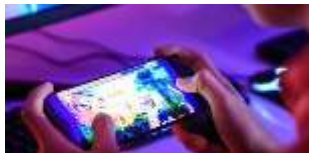
Gambar 2. 1 Game

Kata "Game" berasal dari bahasa Inggris dan dalam Kamus Besar Bahasa Indonesia diartikan 'permainan' atau bisa juga diartikan sebagai aktivitas intelektual yang dapat dimainkan serta melibatkan pengambilan keputusan dan tindakan pemain. Permainan memiliki tujuan tertentu yang ingin dicapai oleh pemainnya dan berfungsi sebagai bentuk hiburan untuk mengurangi kelelahan mental akibat rutinitas sehari-hari Saputro et al., (2022). Game sendiri merupakan permainan berbasis komputer yang dikembangkan menggunakan teknik dan proses animasi (Prabowo, 2016). Menurut Sadiman, A. S., (2010), permainan adalah suatu kompetisi di mana pemain berinteraksi mengikuti aturan tertentu untuk mencapai tujuan, dengan adanya unsur persaingan yang mendorong pemain menemukan strategi dalam menyelesaikan tantangan. Selain itu, permainan elektronik atau game dirancang sebagai hiburan multimedia yang bertujuan memberikan pengalaman yang memuaskan bagi pemainnya. Jika dahulu game lebih identik dengan anak-anak, kini orang dewasa juga ikut serta dalam perkembangannya. Berdasarkan grafis yang digunakan, game diklasifikasikan menjadi dua jenis, yaitu game 2D (dua dimensi) dan game 3D (tiga dimensi) Permatasari & Puspasari (2020).