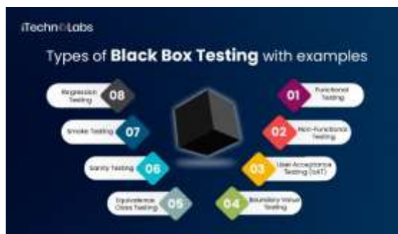
Gambar 2. 7 Black Box Testing

Pengujian BlackBox adalah salah satu metode dalam pengujian perangkat lunak yang menitikberatkan pada evaluasi fungsionalitas sistem tanpa melihat atau mengetahui struktur internal maupun kode sumber aplikasi. Fokus utama dari metode ini adalah untuk memastikan bahwa input yang diberikan menghasilkan output yang sesuai, sesuai dengan spesifikasi yang telah ditetapkan. Metode ini sangat penting dalam menjamin kualitas perangkat lunak dari perspektif pengguna akhir, karena pengujian dilakukan berdasarkan perilaku sistem yang tampak di luar. Meskipun tidak menyentuh bagian dalam dari perangkat lunak, pengujian blackbox mampu mengidentifikasi kesalahan pada fitur, kegunaan, serta aspek keamanan aplikasi. Dengan demikian, pendekatan ini efektif untuk menilai sejauh mana aplikasi bekerja sesuai dengan kebutuhan pengguna dan standar yang diharapkan (Setiawan, 2021).