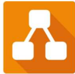
Gambar 2. 6 Draw io

Draw.io, yang kini dikenal dengan nama Diagrams.net, merupakan perangkat lunak lintas platform untuk membuat diagram, yang dibangun menggunakan teknologi HTML5 dan JavaScript Emny Harna Yossy (2023). Aplikasi ini memfasilitasi pengguna dalam merancang berbagai macam diagram, termasuk diagram alur, diagram organisasi, diagram UML, dan jenis diagram lainnya.