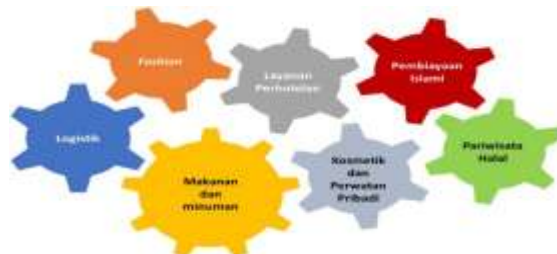
Gambar Cakupan sector industry halal dunia

Kuantitas konsumen muslim yang besar tentunya akan memberikan peluang yang besar pula untuk berkembangnya industri produk halal. Industri makanan halal memberikan jaminan keamanan pangan halal bagi konsumen sesuai dengan ketentuan syari'ah Islam. Produsen pangan dunia akan berupaya mengembangkan dan meningkatkan produksi produk halal untuk mengisi pasar dunia. 18 Potensi pasar halal global sangat berkaitan erat dengan perilaku konsumsi universal. Islam sebagai jalan hidup umat Islam menyentuh semua aspek kehidupan termasuk perilaku konsumsi. Perilaku konsumsi ini menyentuh banyak aspek seperti industri makanan dan katering, sistem keuangan, pariwisata, penampilan, layanan pendidikan, layanan amal, layanan kebutuhan harian individu, hingga infrastruktur pendukung industri halal. Ini adalah daya tarik universal karena sesuai dengan standar mutu seperti gizi yang baik, ramah lingkungan, aman, terpelihara, bersih, sehingga di masa depan produk halal tidak secara eksklusif diposisikan untuk umat Islam saja, tetapi secara universal sebagai hasil dari daya tarik tingkah laku konsumen. Pada uraian selanjutnya akan diuraikan potensi pasar halal, baik di level global (dunia) maupun potensi pasar halal di Indonesia. 19